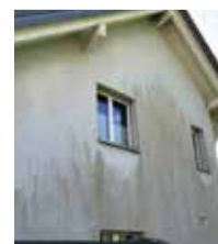
Putzfassade mit Grünalgenbefall.

Die Fachleute lösen das Problem im Selbstreinigungsverfahren. Der Desinfektionswirk-