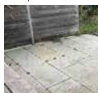
Sandsteinplatz nach einem Jahr.

stoff en fern zuverlässig organischen Befall in Form von Algen, Moosen, Flechten oder Schimmelpilz nachhaltig von Fassaden, Dächern, Steinbelägen, Terrassen oder Mauerwerk. Ist der Wirkstoff erst einmal aufgetragen, reinigt sich die Oberfläche nach einiger Zeit ganz von selbst. Das verwendete Produkt ist chlor und javelfrei, amtlich geprüft, oberflächenschonend und ohne aggressive Wirkstoffe. Dank der Nachhaltigkeit, bleiben die behandelten Fassadenflächen durch- schnittlich 10 bis 15 Jahre sauber.