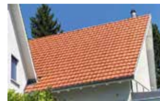
Das Dach circa ein Jahr später.