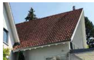
Tonziegeldach mit Schwarzalgenbefall.

Den Teigdünne zu einem grossen Rechteck ausrollen und mit verquirltem Ei bestreichen. Den Alpkäse und Schinken oder gehobeltes Gemüse auf dem halben Teig verteilen, die zweite Teighälfte darüber schlagen und leicht andrücken. Alles in 2 cm breite Streifen schneiden. Die Streifen mehrmals eindrehen und nochmals mit Ei bestreichen. Im vorgeheizten Backofen circa 15 Minuten bei 180 °C Umluft backen.