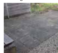
Sandsteinplatz mit Flechtenbefall.