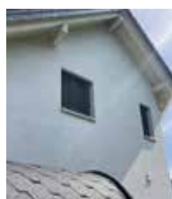
Fassade circa ein Jahr später.