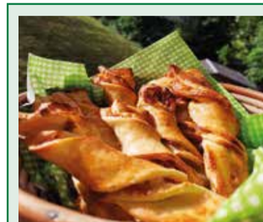
Alpkäsestangen – der Snack für das nächste Apéro oder Picknick